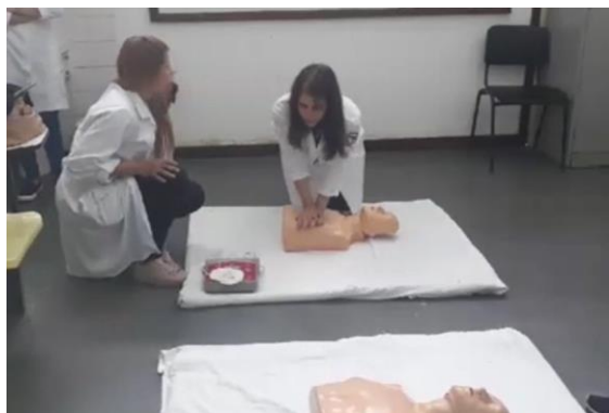
Imagem 1: Treinamento em RCP sendo realizado

Segundo as políticas atuais de desfibrilação precoce, o uso e instalação do desfibrilador externo automático (DEA) é indispensável obtenção de resultados satisfatórios em vítimas de PCR 1 . Há necessidade treinamento para o conhecimento das manobras de ressuscitação cardiopulmonar (RCP) e habilidade no manuseio do DEA. De acordo com a lei brasileira, o DEA deve estar disponível como item obrigatório em locais públicos de alta circulação (número de pessoas \geq 2000 /dia), locais de eventos com o mesmo fluxo de pessoas do citado anterior, em meios de transporte com número \geq 100 passageiros/dia e veículos para uso em emergência 2 . O objetivo do presente estudo foi avaliar a influência da realização de cursos práticos em manobras de RCP e manuseio do DEA no aprendizado do estudante de medicina.